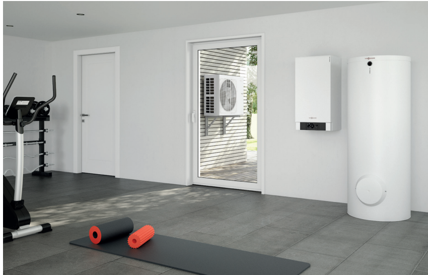
Pompe à chaleur air/eau Vitocal 100-S, ballon d'eau chaude sanitaire Vitocell (à droite) et unité extérieure.

Neuf ou rénovation, la solution adaptée et performante.