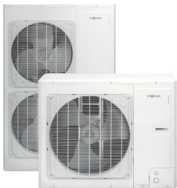
Unités extérieures pour Vitocal 100-S/111-S