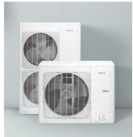
Unités extérieures Vitocal 100-S

L'utilisateur bénéficie de la simplicité d'utilisation du système de commande Vitotronic 200 : le menu de réglage est structuré de manière logique et facilement compréhensible, l'affichage rétroéclairé et contrasté permet une bonne lisibilité des informations. Une fonction d'aide contextuelle est à votre disposition en cas de doute. Vous pouvez à tout moment consulter votre consommation d'énergie en kWh pour le chauffage et l'eau chaude sanitaire, conformément aux exigences de la RT 2012.