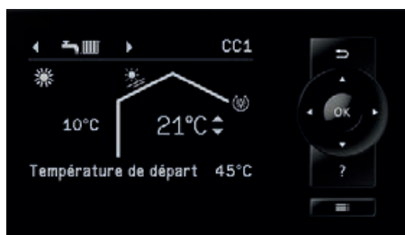
Système de commande de pompe à chaleur Vitotronic 200