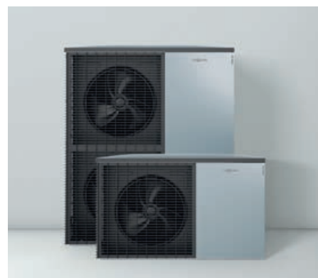
L'unité extérieure au design Viessmann – Made in Germany.

En accessoire, la pompe à chaleur peut également être connectée par Vitoconnect. L'utilisateur peut piloter son chauffage à distance à partir de son smartphone ou de sa tablette. En accord avec l'installateur, une maintenance ainsi qu'une surveillance à distance sont réalisables.