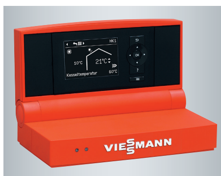
Régulation Vitotronic avec menu déroulant clairement structuré