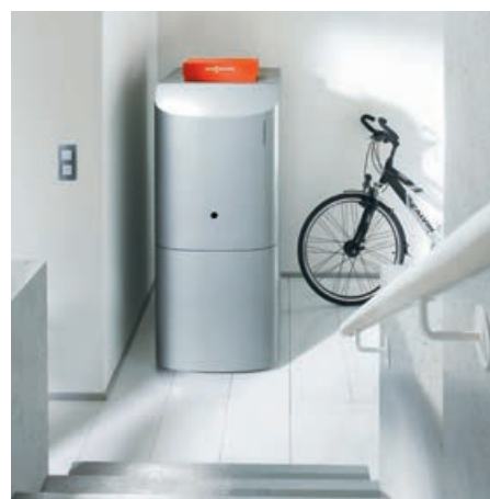
Vitorondens 222-F avec ballon d'eau chaude sanitaire intégré

Bénéficiez de la simplicité d'utilisation de la régulation Vitotronic 200 : intuitive et conviviale, la régulation vous permet de gérer un circuit direct (radiateurs) et jusqu'à deux circuits avec vanne mélangeuse (radiateurs ou plancher chauffant).