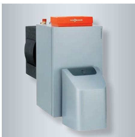
Vitorondens 200-T de 67,6 à 107,3 kW